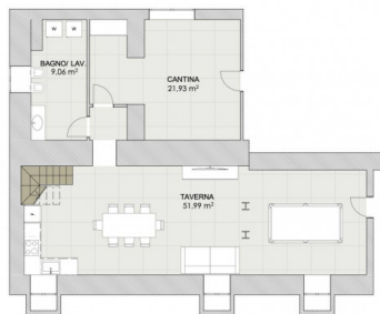
PIANO INTERRATO scala 1:100